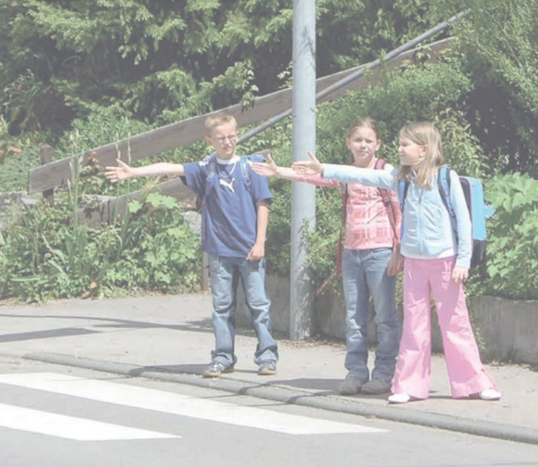
Privatgymnasium Parkingschule Mönchsbergschule